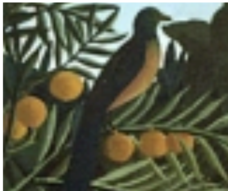
un oiseau orange et bleu