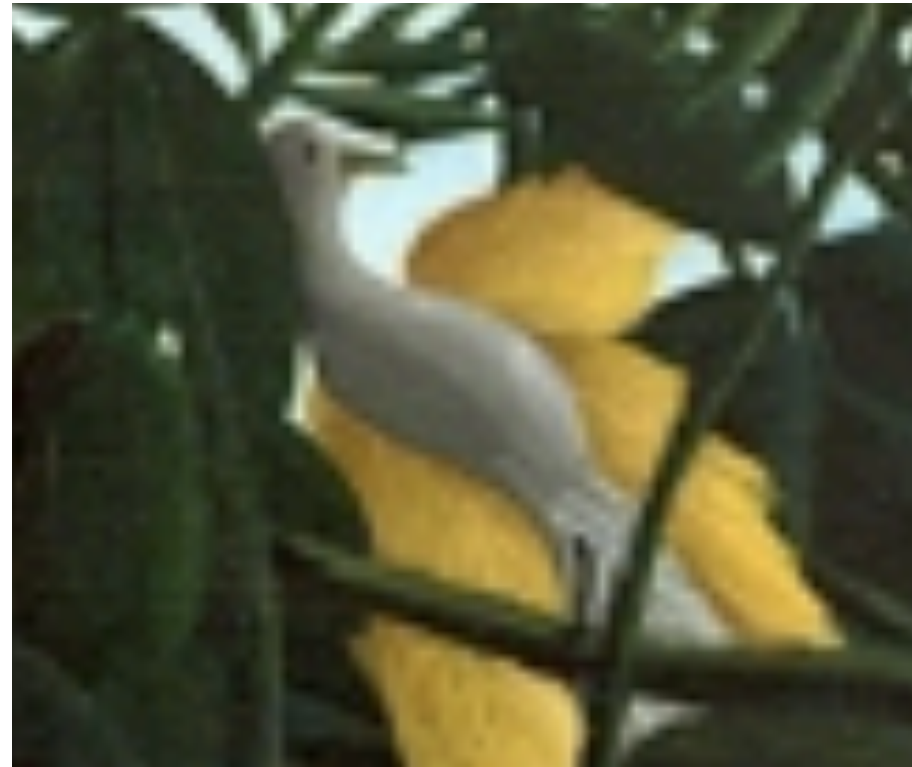
un oiseau gris