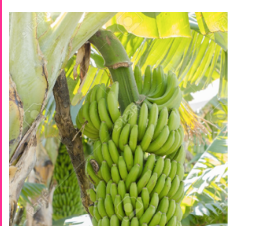
Un régime de bananes